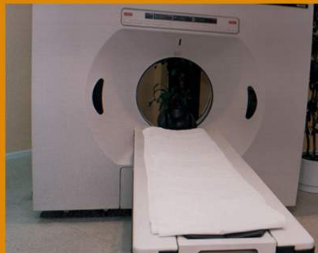
1985 1 er TAC Clínica Belén