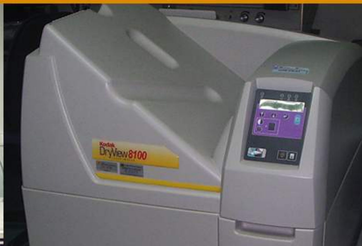
1997 1 a Impresora Láser Seca