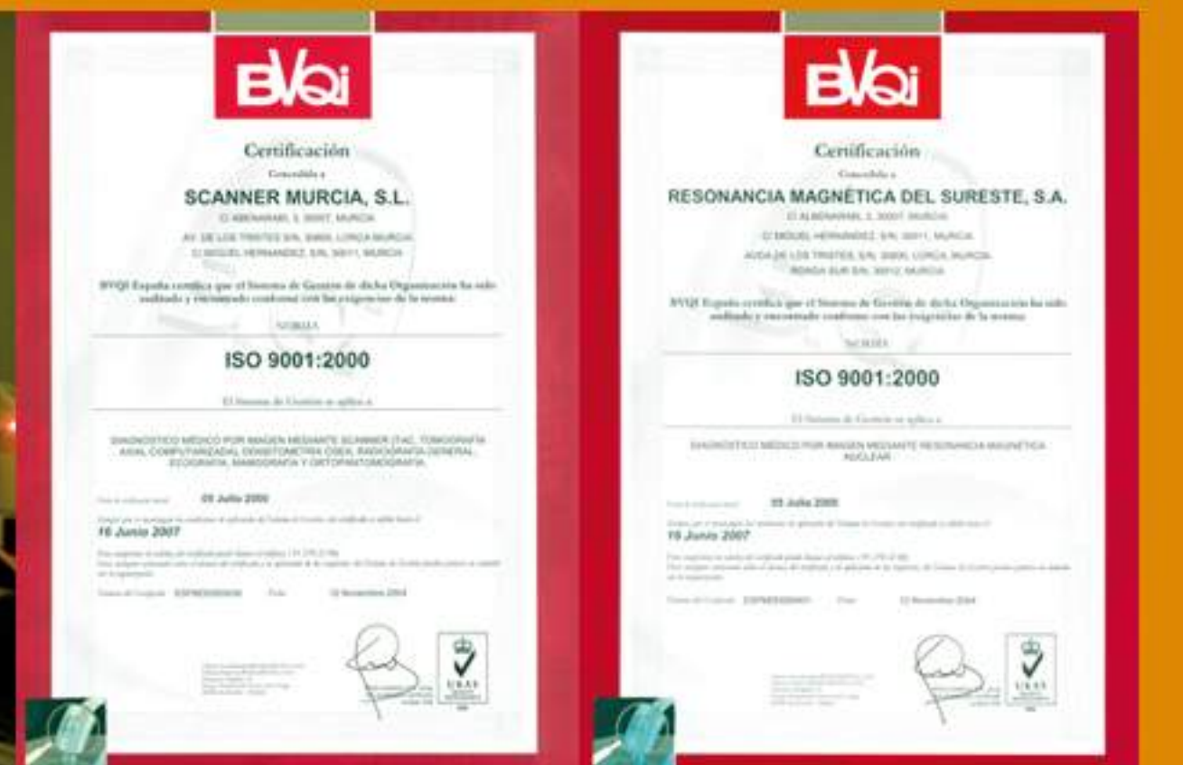
2000 1 a ISO 9001 del Sector