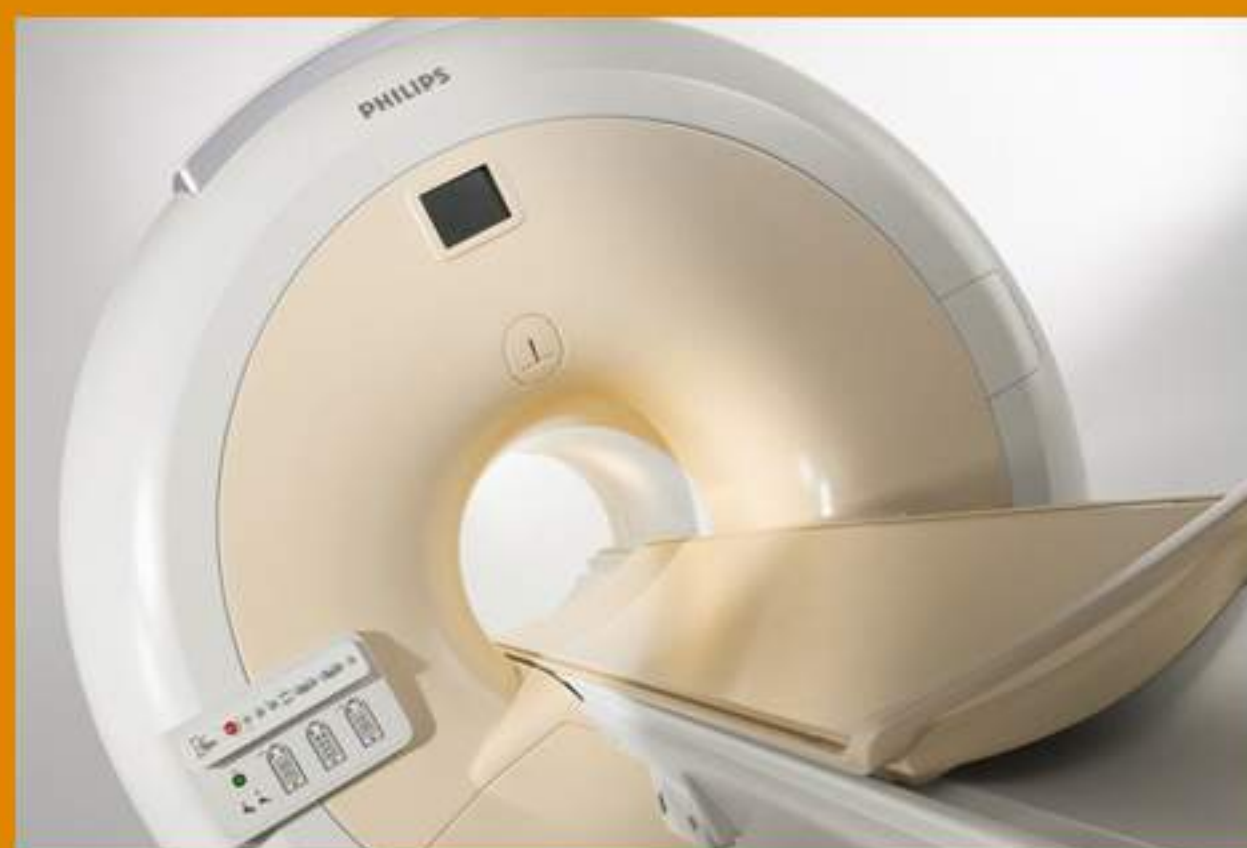
2009 1 a RM Alto Campo Cieza