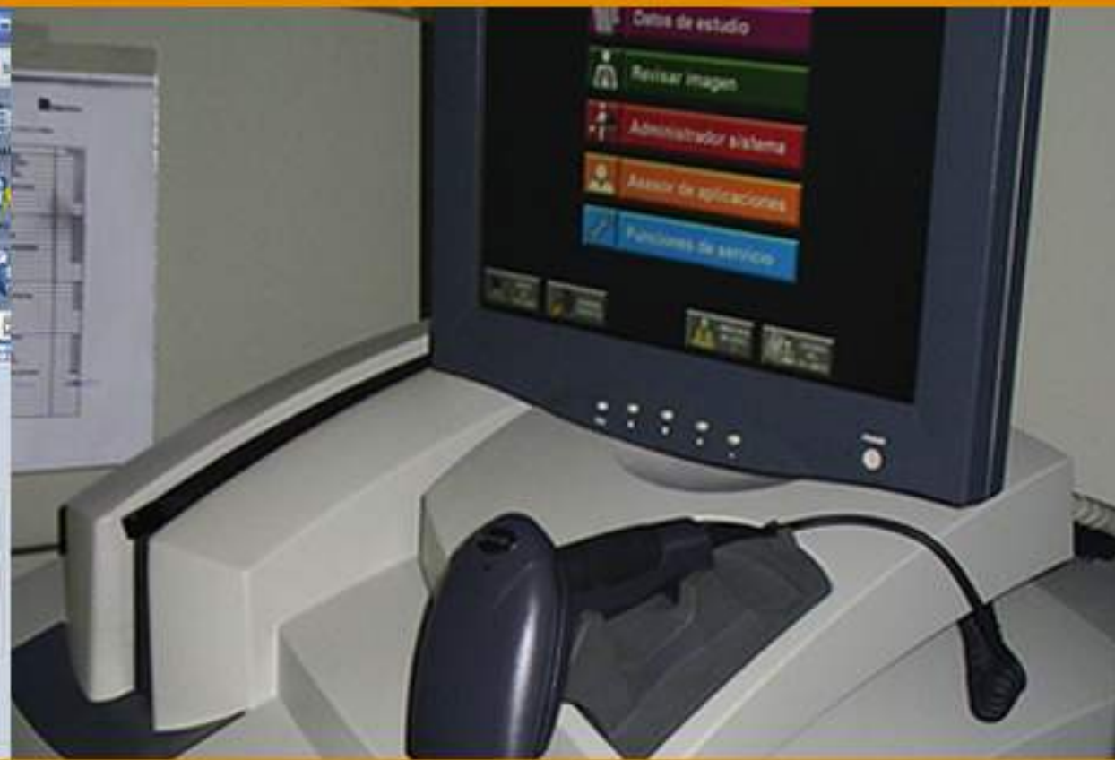
2004 1 er Digitalizador CR