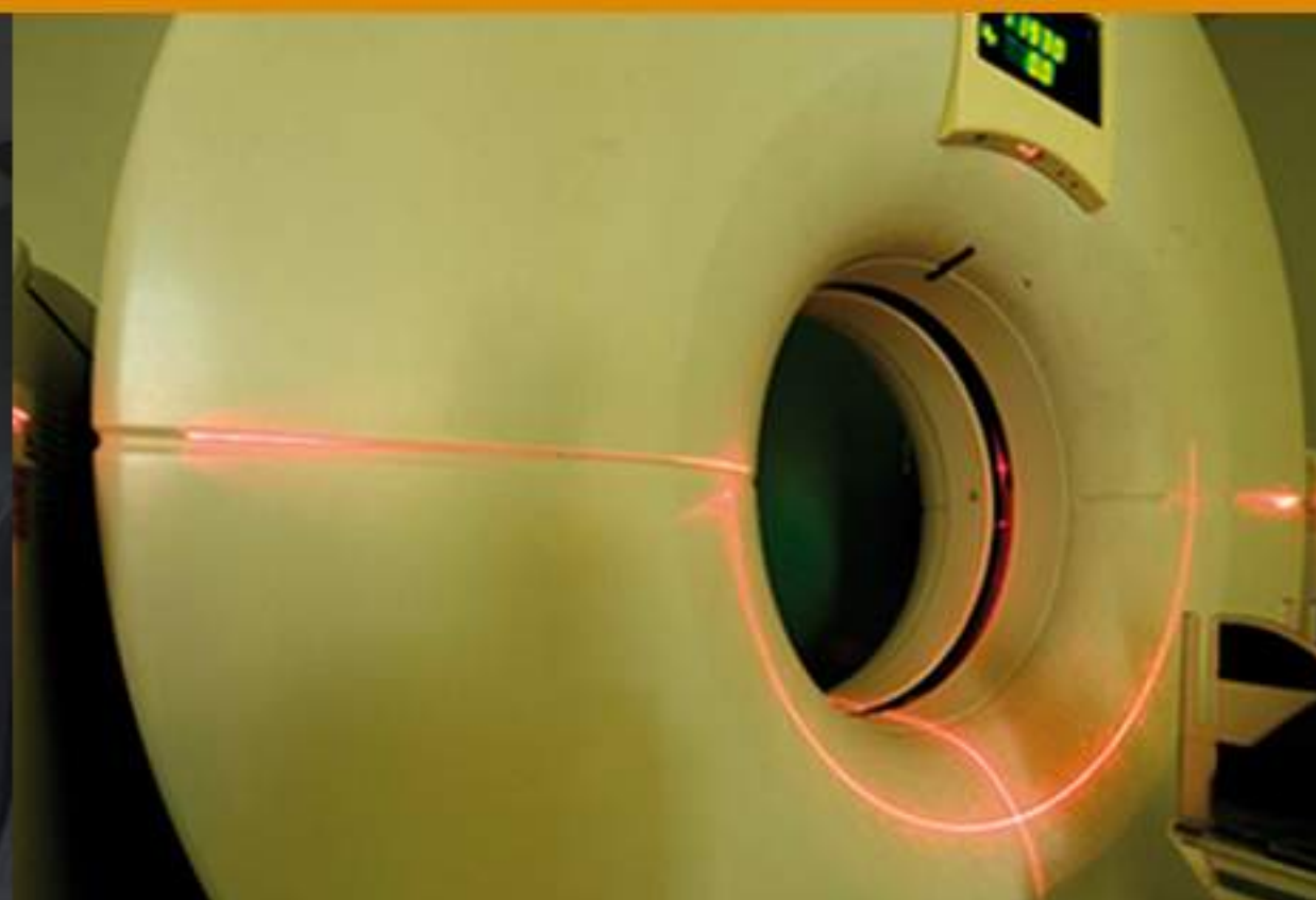
1999 1 er TAC 3D Abenarabi