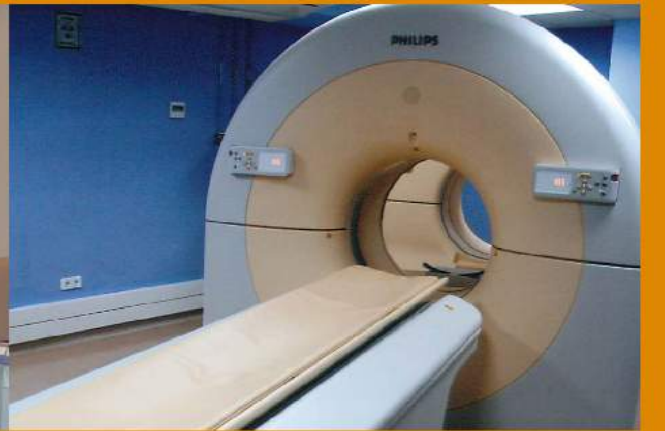
2006 1 er PET-TAC Arrixaca