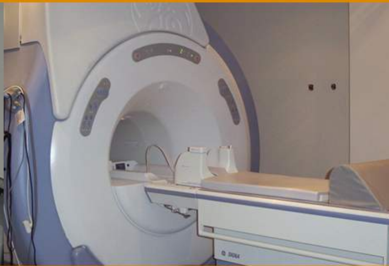
2004 1 a RM 1.5 T Mesa Castillo