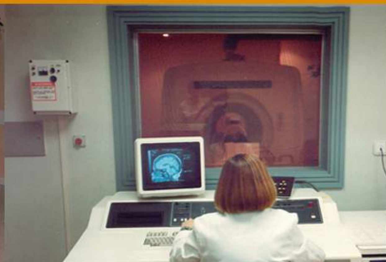
1990 1 a RM San Carlos