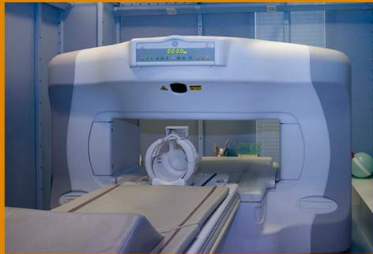
2002 1 a RM Abierta Abenarabi