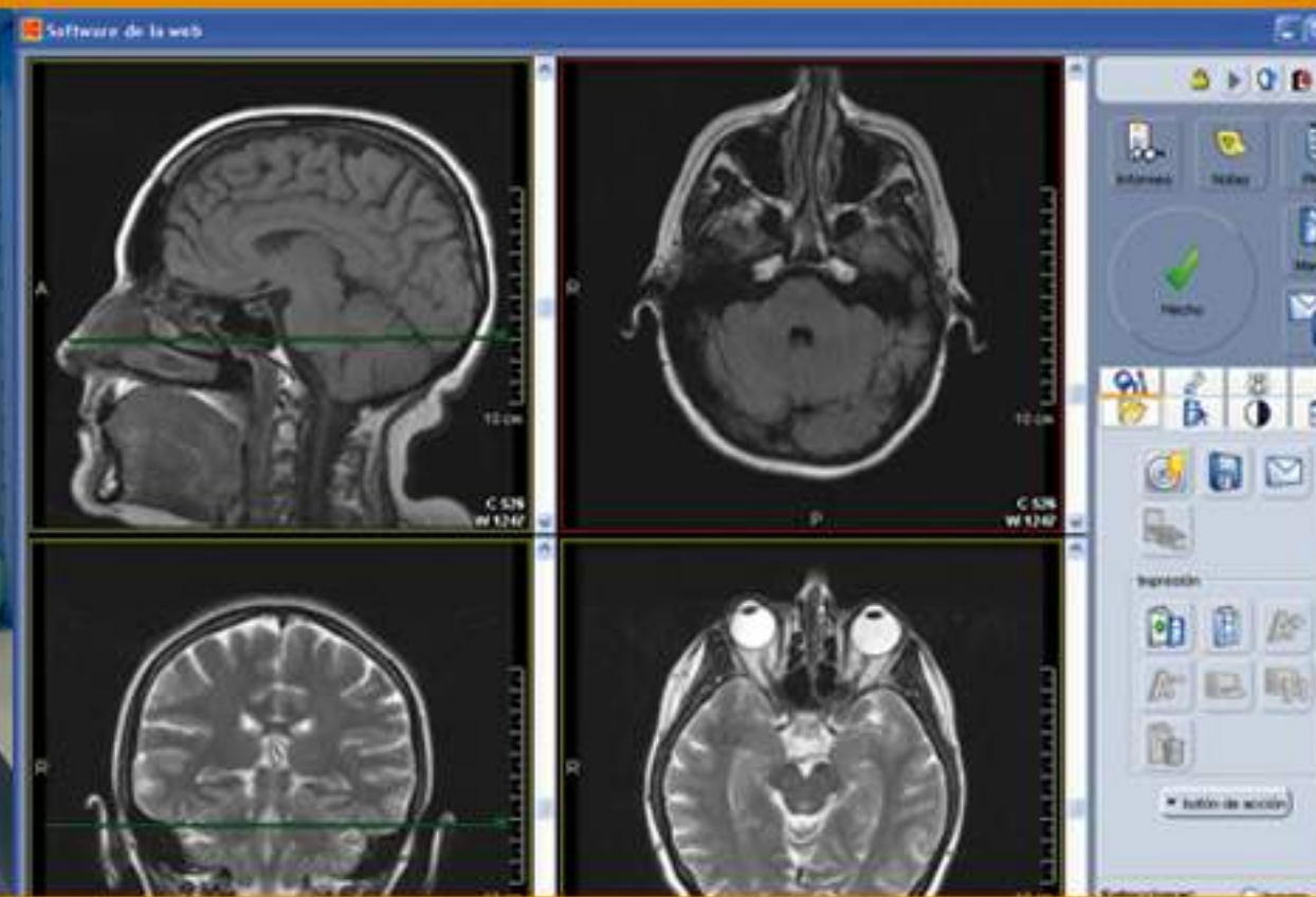
2002 1 er DMI --> PACS