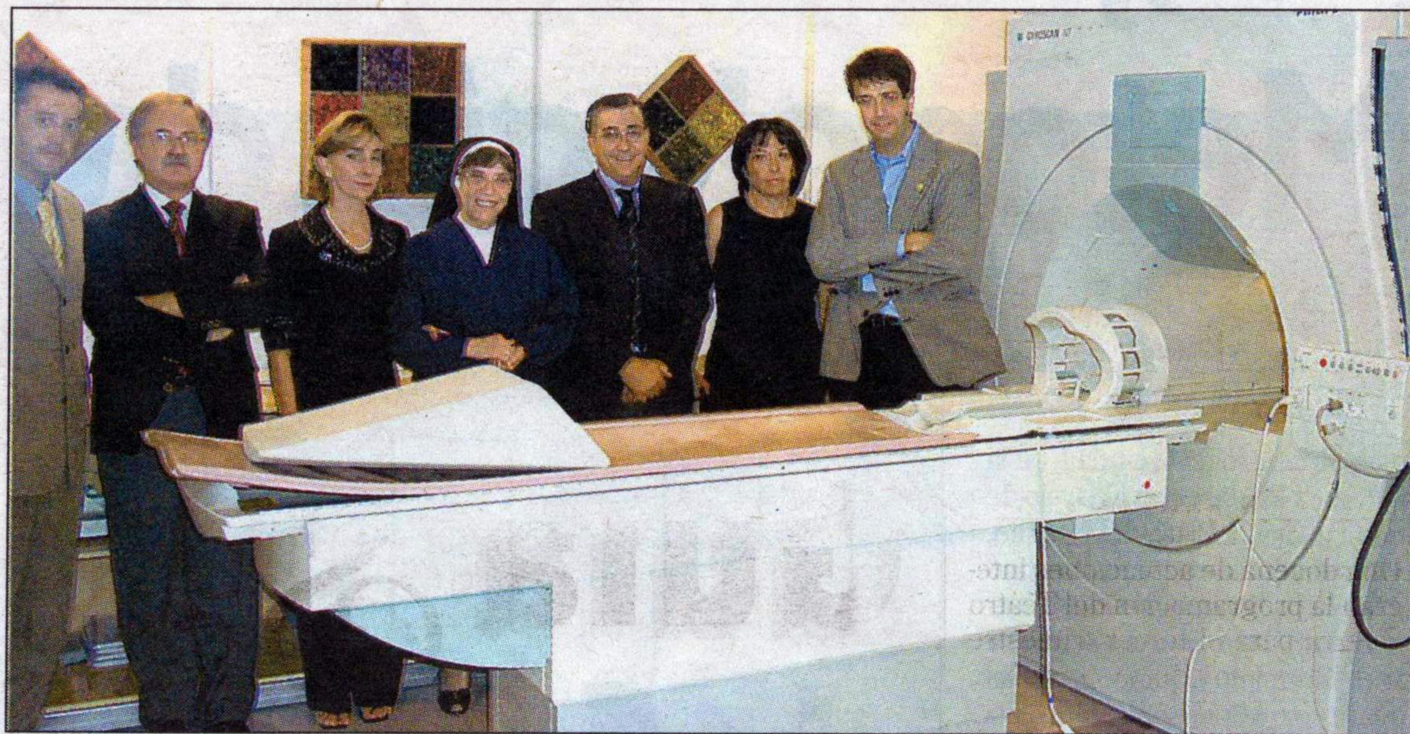
En la imagen, algunos de los asistentes a la inauguración junto a la nueva resonancia magnética.

Este grupo lleva trabajando en Murcia más de 15 años en estas labores y han logrado un reconocido prestigio.