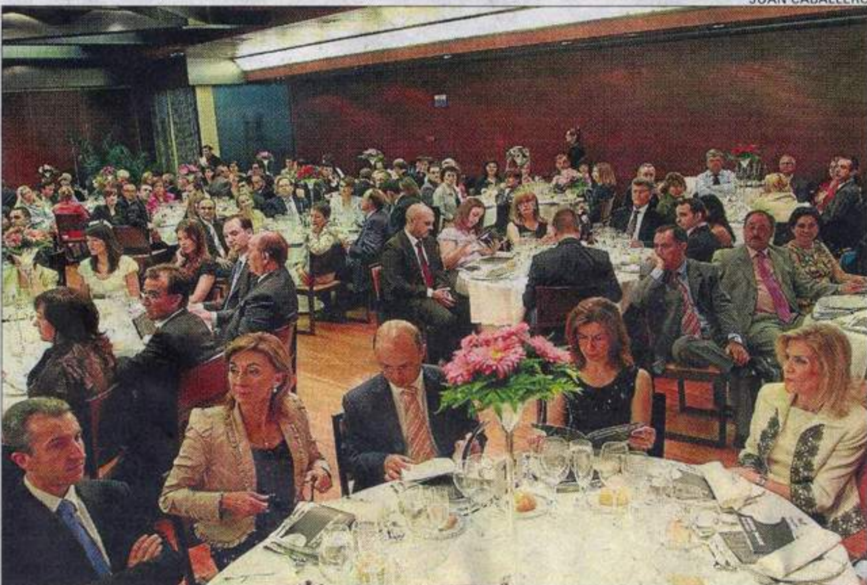
La Noche de la Economía reúne cada año a representantes de todo el tejido empresarial