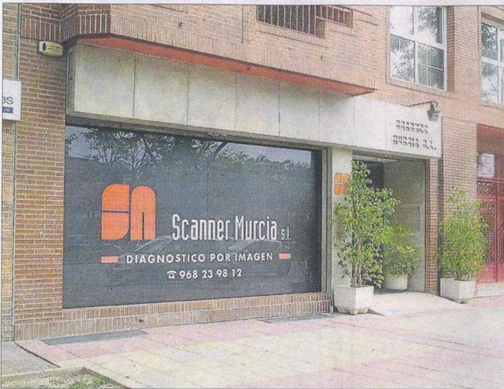
Fachada de la sede central Scanner Murcia, ubicada en la calle Abenarabi. L.O.